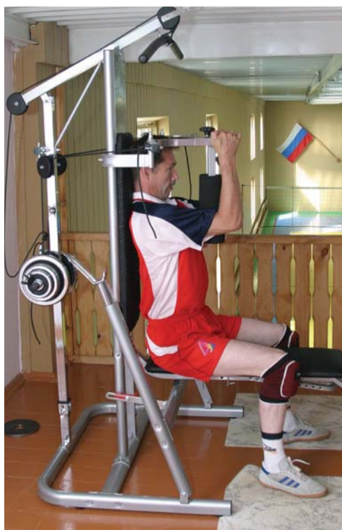
В тренажерном зале