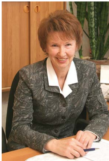
Инженеров-строителей. Сметчиков. Геодезистов. Без этих мастеров — работы нет всей организации.

А справедливости ради надо сказать, что без проектно-сметного отдела — никуда. Значит, без его профессионалов: технологов проектирования магистральных газопроводов высокого давления, газораспределительных сетей низкого давления. Специалисты по инженерному оборудованию и коммуникациям: отопление и вентиляция, водопровод и канализация, электрическая часть и КИП и А.